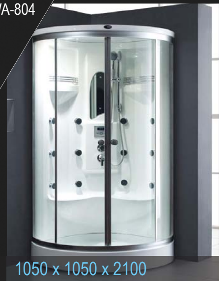
1050 x 1050 x 2100