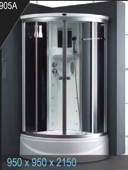
950 x 950 x 2150