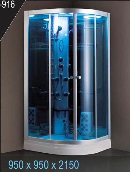
950 x 950 x 2150