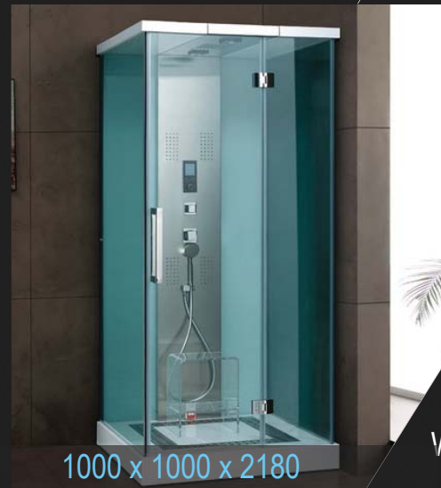
1000 x 1000 x 2180