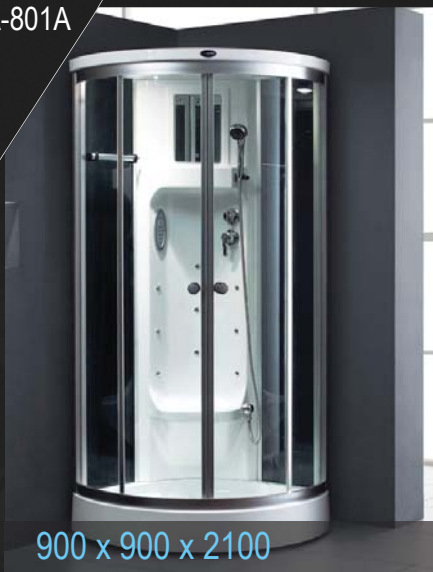
900 x 900 x 2100