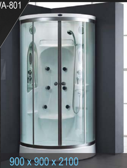
900 x 900 x 2100