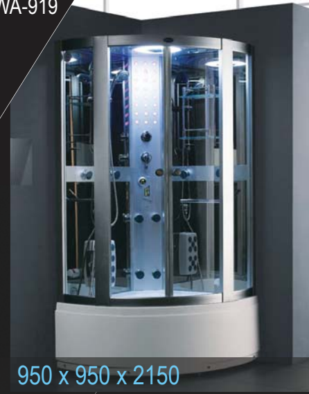
950 x 950 x 2150