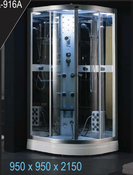
950 x 950 x 2150