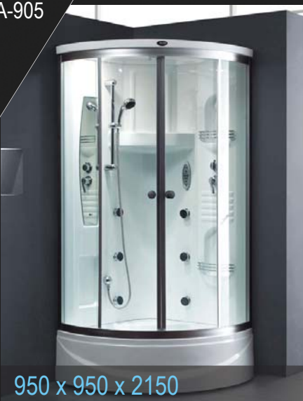
950 x 950 x 2150