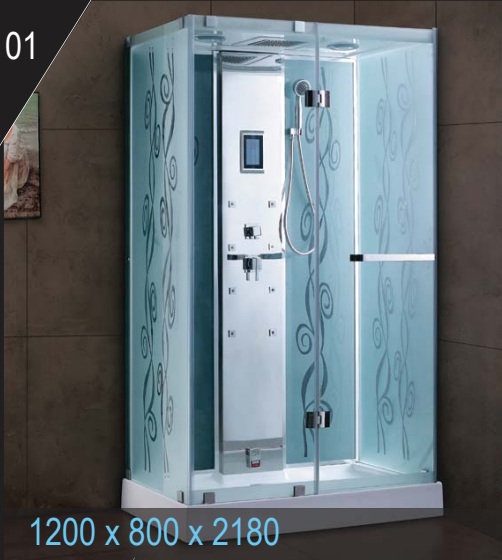
1200 x 800 x 2180