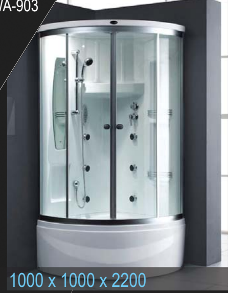
1000 x 1000 x 2200