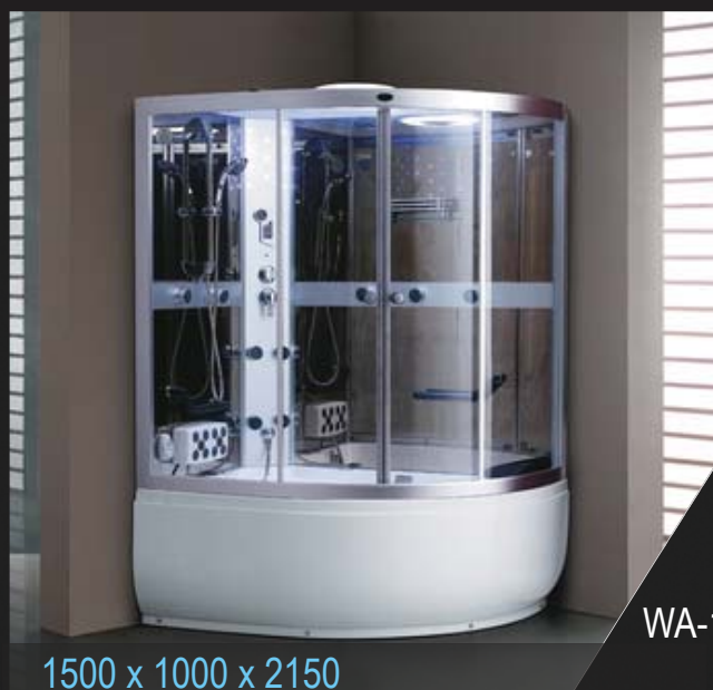
1500 x 1000 x 2150