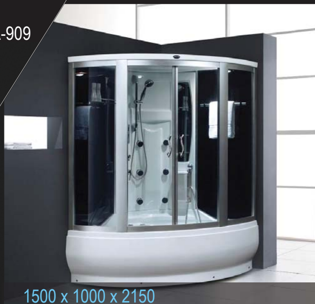
1500 x 1000 x 2150