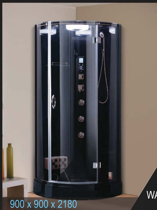
900 x 900 x 2180