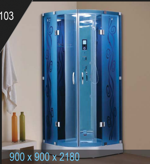
900 x 900 x 2180