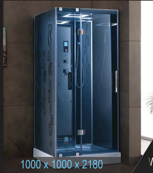
1000 x 1000 x 2180