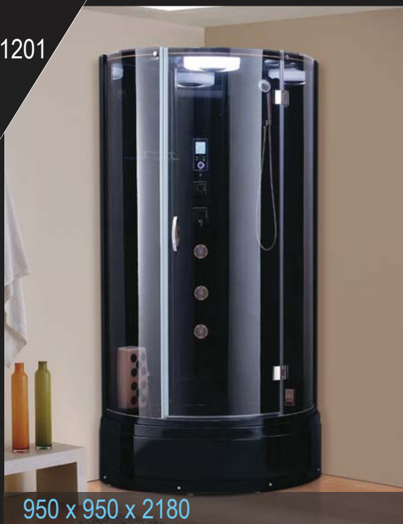
950 x 950 x 2180